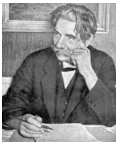
Альберт Швейцер, 1955 г.